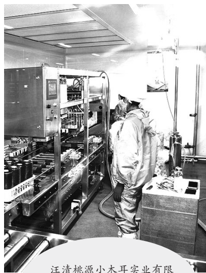
汪清桃源小木耳实业有限公司全面复工,保证黑木耳正常生产。

下一步,东丰县将充分运用“益农信息社”线上线下创新型服务网络的效能,全面赋能农业、农村、农民、农企,促进农业新旧动能转换,推动乡村振兴战略和农业高质量发展。