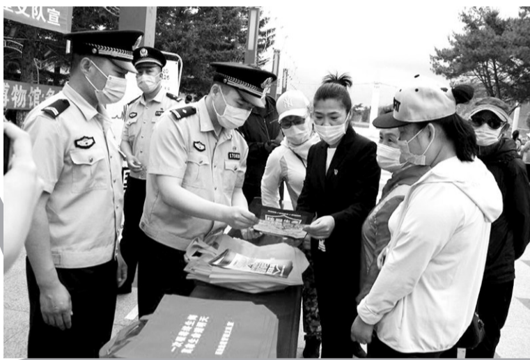
近日,延边边境管理支队联合图们市新华街道新民社区开展了“珍爱生命,远离毒品”禁毒宣传活动。

通过这次主题党日活动,使全体党员和积极分子增强了党性、提升了思想觉悟。大家纷纷表示,要以先辈先烈为榜样,传承和发扬伟大的抗联精神,坚定理想信念,坚守林业人“为山河装点锦绣、把国土绘成丹青”的初心,立足本职岗位,扎实履行职责,为生态建设和森林资源安全贡献自己的力量。