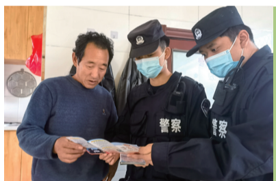
近日,延边边境管理支队二道边境检查站扎实推进“立足岗位作贡献”活动,帮助群众解决实际困难。

练及消防技能培训,提升员工消防理论水平。强化实战演练技能,定期组织开展防火演练,着重培养员工“分工协作自救、扑救初始火灾、组织人员疏散逃离、正确使用灭火器”四个能力,提升员工应急处置能力。外强宣教,意识上深化。充分发挥“宣传员”和“主推手”作用,组建消防宣传小分队,结合地域特点,走进社区、集市、村屯等人集密集场所,发放宣传资料,面对面向群众宣讲消防安全知识。(尹永梅 吴长福)