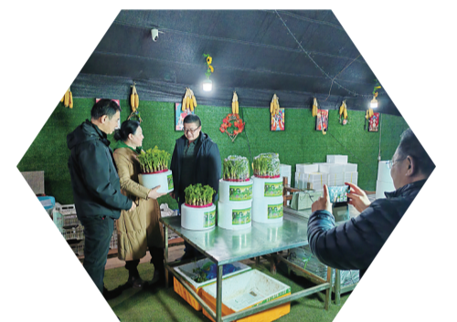
大棚里,水灵灵、鲜嫩嫩的刺嫩芽、山芹菜、婆婆丁,展现着春天的勃勃生机。