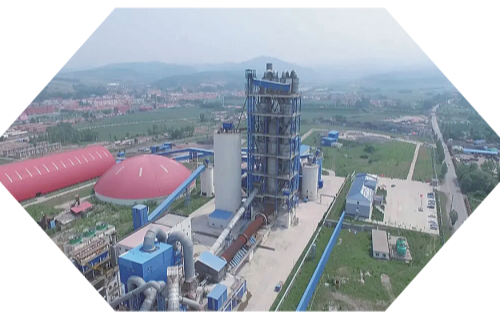
山水水泥厂正在一步步将建设全省最美水泥厂的蓝图变成现实。