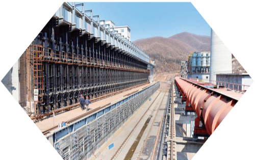
新投产的现代化生产线高效运转,一辆辆满载焦炭、LNG的专用车辆有序驶出厂区。