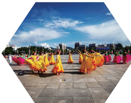
形式多样、生动鲜活的文化活动,成为微笑江源的“亮点”和“看点”。

从“换一种打开方式”与德相识,到“感恩有你”一连串系列活动,再到“日有所长”精彩呈现,“微笑江源”主题活动让江源这座洋溢着欢笑、富有温度的小城正在慢慢实现蝶变——