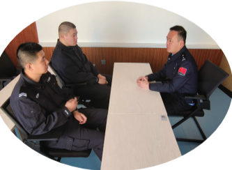
近日,安图县双目峰边境检查站组织辅警开展季度谈心谈话活动。

压紧压实企业责任。乡党委、乡政府与第三方企业吉林德耀生物能源签订责任书,要求企业要抢时间、赶进度,确保在春耕前完成今年农家肥还田工作任务。截至目前,全乡有4个村实现农家肥还田全覆盖。