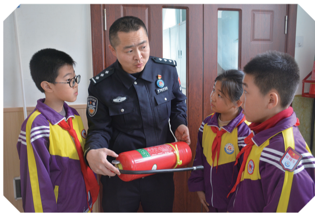
近日,白山边境管理支队兴隆边境派出所民警走进建国小学开展消防演练及安全宣传教育,进一步提升师生的消防安全意识。

丰满区将以“清河行动”为契机,以保护水资源、防治水污染、改善水环境、修复水生态为主要任务,不断巩固和提升全区水生态环境质量,强化党员干部爱河、护河意识,不断推进生态河道建设,推动“清河行动”常态化、长效化,共同绘就“河畅、水清、岸绿、景美”的生态画卷。(海涛)