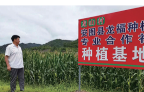
户分红950多元，村集体分红6.23万元。同时，合作社带动村民就业100余人次，为村民增收5万余元，真正实现了“抱团发展”。

龙山村积极探索“党支部+合作社+农户”的运营模式，通过村干部带头出资入股、村集体投入、农户入股的方式，期间得到帮扶单位吉林省信托公司为合作社出资10万元，使全村资源、资产、资金合理利用。2023年，合作社共种植玉米13公顷，产量12.3万公斤，销售24.9万元，合作社盈利10万余元，社员分红2万余元，社员平均每