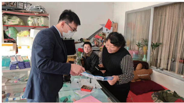
为进一步加强电子支付惠民知识普及,推动电子支付普及工作的常规化和规范化,建立普及金融知识的长效机制,长白联社开展形式多样的宣传活动,提升电子支付服务质效。

为进一步加强农村道路交通安全,交警大队结合春耕时节农村道路交通违法特点和群众出行规律,合理规划近期交通治理重点时段、重点路段,积极查找当前农村道路交通安全管理工作存在的不足,结合春耕期间辖区农村道路交通安全形势和交通流量、天气变化等情