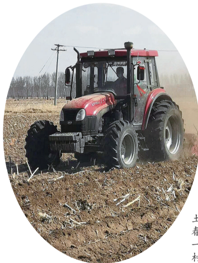
■乾安县让字镇农民抓住当前土壤墒情好的有利时机,迅速掀起春耕整地打垄热潮,为一次播好种一次拿全苗奠定了基础。图为小成村农民在整地。

强化宣传培训,合力绘好“生态图”。组建以党员为主要力量的志愿者服务团队,结合“七城”创建工作要求,常态化开展河道环境卫生整治志愿服务活动累计70余场次;绘制宣传画及宣传标语14处;结合“世界水日”“环保宣传日”等,开展学习宣传宣讲活动20余次,形成了河长带头、多方联动、群众参与、齐抓共管的工作格局,推动实现河共治、水长清。