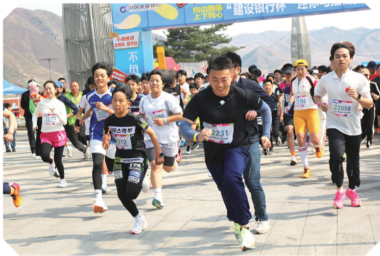
“五一”前夕,图们市向上街道在图们江广场举办“向边图强、上下同心”建设银行杯迷你马拉松赛,全市500余名长跑爱好者参加比赛。

靶向精准防范。全乡机关干部深入包保村,发放农机具反光贴,做到村不漏组,组不漏户,户不漏车;抽调50名机关干部,其中16名为巡逻员,34名为安全员,到重点路口交通劝导站担任交通安全员。