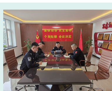
近日,延边边境管理支队二道边境检查站开展“青春心向党,建功新时代”五四青年节系列活动,增强队伍凝聚力。

公司在追求经济效益的同时,不忘环保责任。他们通过引进先进技术和设备,对生产过程中产生的废弃物进行无害化处理,实现资源的循环利用。同时,计划将牛粪与草业过虑筛土改造成育苗土与有机肥,进一步推动农业绿色可持续发展。