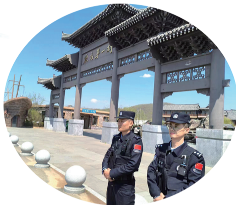
延边边境管理支队杨泡边境检查站全体民警坚守岗位,为打造平安边境奠定坚实基础,诠释移民管理警察的职责与担当。