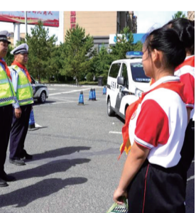
近日,洮南市第四小学师生来到公安交警巡警市一中队高考执勤点,对交警的辛勤工作表示感谢。