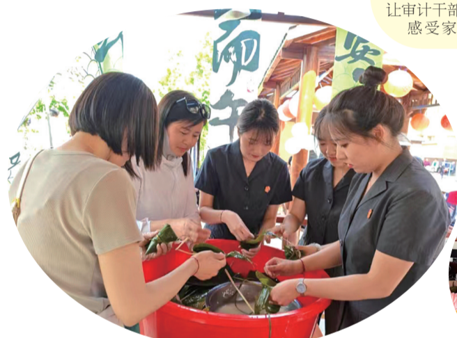
日前,抚松县人民法院组织党员深入松江河镇社会福利中心,开展“粽”情端午敬老安康”主题党日活动,积极引领全社会树立尊老、敬老、爱老意识。