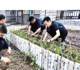
近日,延边边境管理支队双目峰边境检查站开展营区绿化工作。