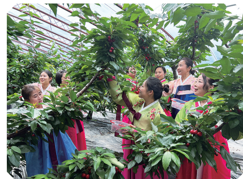
游客棚内采摘大樱桃

近年来,金华乡积极探索农文旅深度融合新路子,充分挖掘大樱桃、小番茄等特色种植兼具经济价值和观赏价值,创新思路,开发采摘体验活动,增加游客互动体验。将棚膜经济打造成兼具采摘、观光等功能于一体的文旅项目,实现全乡从一季生产向多季生产、一季增收向四季增收的跨越,更好地实现“三产融合”。棚膜经济的发展激活了村集体资产的增收潜能,农业发展实现了由传统、粗放型向精细、集约型的转变,形成村集体、合作社、农户三方共赢的局面。