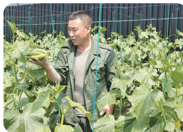
下二股流村蔬菜种植产业