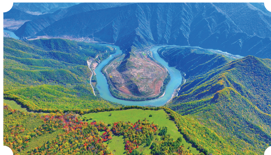
G331国道两侧崇山峻岭,景色宜人

本报记者走进长白县,深入了解沿G331国道乡镇如何结合自身优势,促进经济发展,推动乡村振兴。