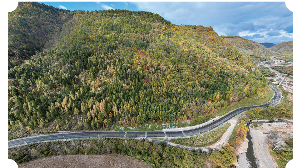
行驶在G331国道,天然的水画卷徐徐展现