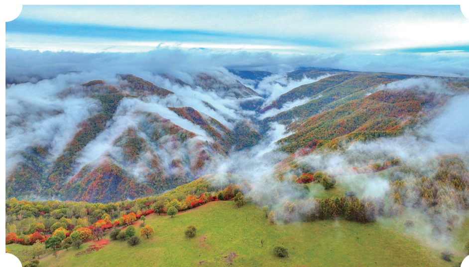
金秋时节,G331沿线风景美不胜收