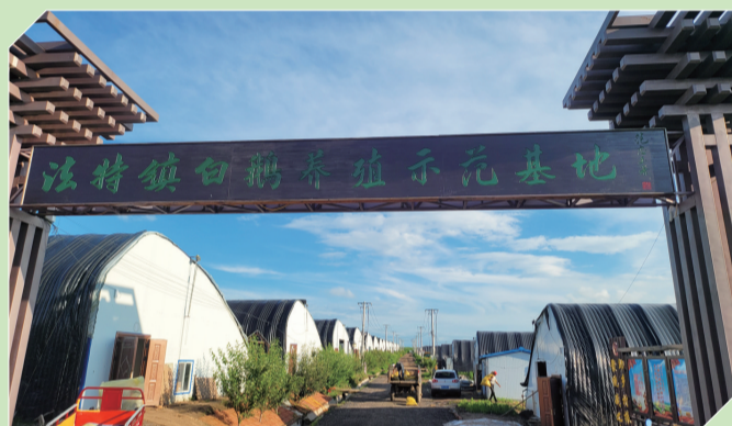
法特镇白鹅养殖示范基地