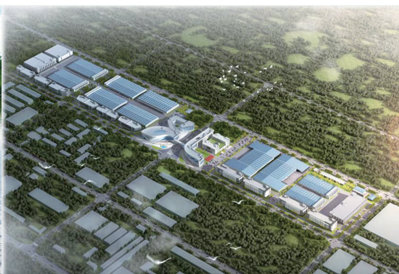
舒兰市白鹅产业园效果图