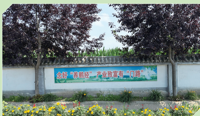
头台村养鹅宣传标语深入人心