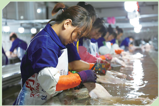
吉林美中鹅业年营业收入2.3亿元

舒兰市将鹅产业一张蓝图绘到底,正以笃行推进的姿态,振翅腾飞,引吭高歌,书写着鹅产业发展的新篇章。