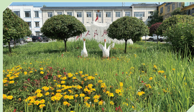
法特镇白鹅元素随处可见