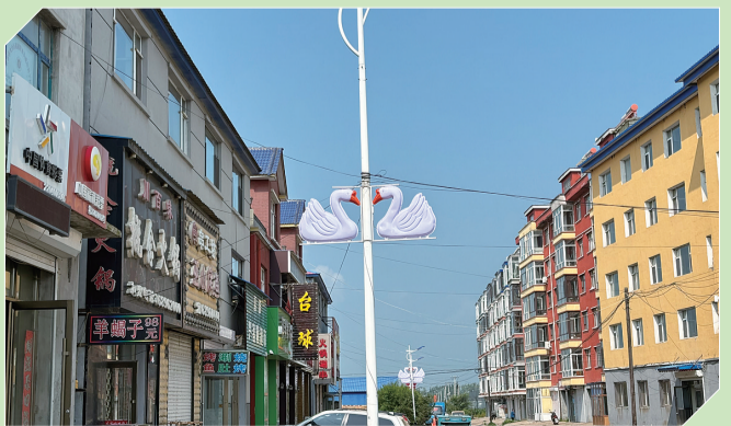
法特镇路与白鹅造型别致

长白山脉峰峦叠嶂,松嫩平原沃野平畴。我省东北部的舒兰市,一场以鹅产业为核心的发展浪潮席卷而来,为这座“果实之城”注入了新活力。鹅产业如同一股强劲的东风,吹拂着舒兰市乡村振兴的田野,带动着农业增效、农民增收的新浪潮。