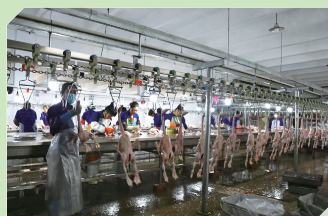
吉林美中鹅业现代化屠宰分割加工生产线