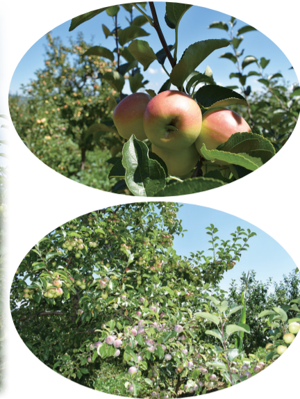
果农正在进行果期管理

异议书面材料送达地址:梨树县不动产登记中心,邮编:136500 联系电话:0434-5252018,5252002 梨树县不动产登记中心 2024年7月29日