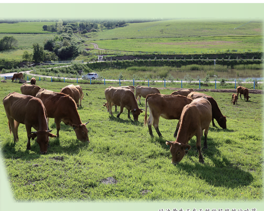
延边黄牛正在天然牧场悠然地吃草