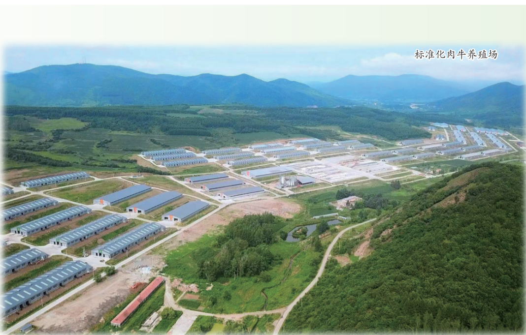
标准化肉牛养殖场

“吉牛中国牛”很牛。今年上半年,我省肉牛饲养量达到604.4万头,同比增长12%,增速高于全国平均水平14个百分点,位居东北三省第1位;屠宰量达到22.1万头,同比增长123%;肉牛全产业链产值达到1205.7亿元,同比增长9.1%……目前,“吉牛中国牛”不仅构建了一个涵盖良种繁育、养殖、交易到屠宰精深加工的全链条产业体系,更在总量规模、质量标准、种源建设等方面领跑全国。 在肉牛产业发展压力骤增的情况下,“吉牛中国牛”何以领跑全国?