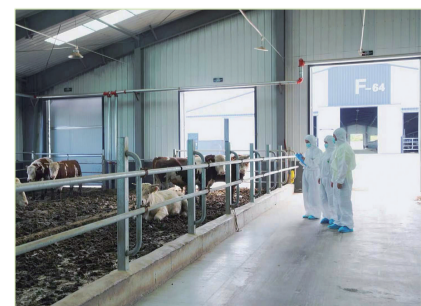
细化肉牛防疫工作