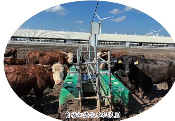
自动加热饮水机装置