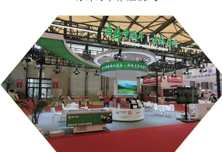
“吉牛中国牛”宣传推介