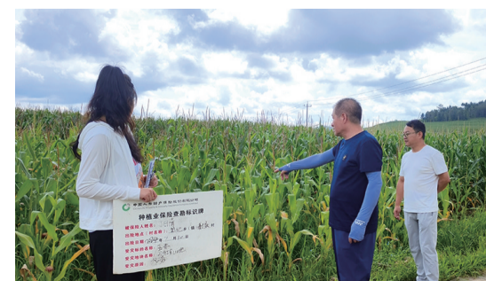
支公司员工深入乡村开展查勘工作