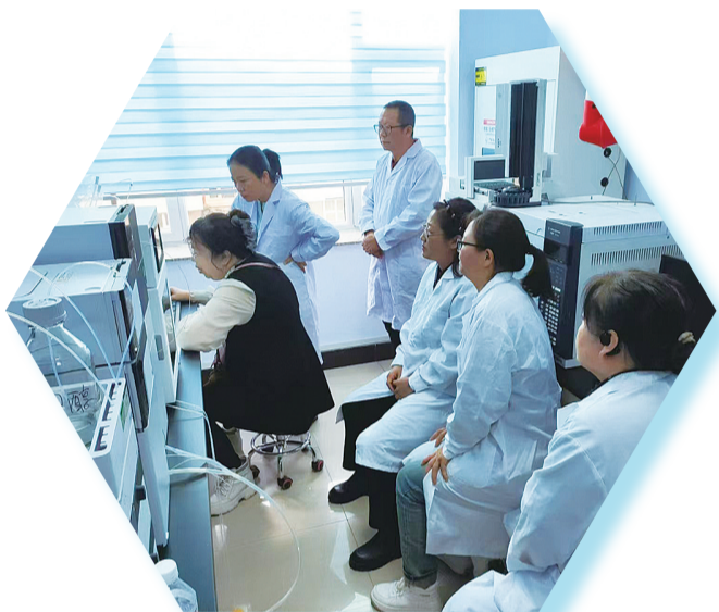
为进一步强化农产品质量安全监测体系,提升基层农产品质量安全检测人员技术水平,近日,白山市农产品检测中心专家到白山市农产品检测中心开展农产品检测技能培训。