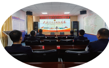
近日,龙井市开山屯边境派出所组织民警观看全国“公安楷模”特别节目。

强的运营实力。在经营过程中,晟安汽车服务有限公司为上千名司机创造了灵活就业和再就业机会。随着网约车司机规模的不断扩大,司机收入得到改善,在促进就业方面发挥了重要作用,成为长春市交通服务领域的新生力量。