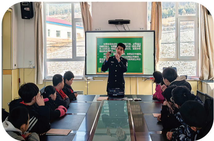
近日,白山边境管理支队金华边境派出所深入辖区学校、幼儿园开展法治进校园活动。

会出席,建议法官借此机会执行。执行小组决定采取“隐蔽执法”。婚礼当天,警车停在宾馆附近,待仪式结束,执行干警身着便衣找到李某。执行法官告知李某,婚礼前他们就