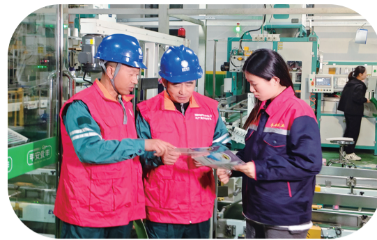
秋收期间,国网舒兰市供电公司组织党员服务队深入厂区、车间,协助企业开展安全用电检查。

公安处班子成员分片包保督导,指挥中心24小时运转,强化视频巡查与警情调度。全体民警坚守岗位,执行24小时值班备勤,服务旅客700余人次,处置突发事件13起。